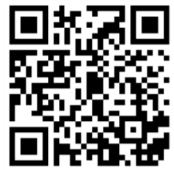
Video: „Die ersten 6 Wochen im Studium!“