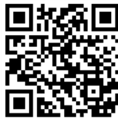
Eezi goIN' Studienstart

„Insgesamt hat eezi mir den Einstieg ins Studium erleichtert und mir geholfen mich im Studium und in Karlsruhe zurecht zu finden“ - eezi Teilnehmer